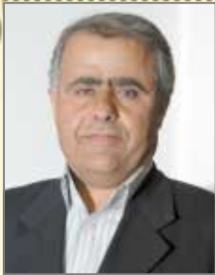
نازاد نهرگوشی - پیرمام

خانه نشین بوو، دلی تهنیا به کونه سهربازه کهی خوش بوو، هیتشتانیش سهرکرده بوو، چونکه که سیتیک مابوو که فهرمانی پین بدات، زورجاریش به نادلی به سهربازه کهی دهگوت: بۆ ژبانی خۆت کردۆته قوریانی ژبانم؟ گهردهنت نازا بی برۆ، بۆ خۆت کیتوه ده پۆی برۆ، کۆنه سهربازیش له قولاپی دلپه وهی دهگوت: بۆ کوی برۆم قوریان، من له م شپوه ژبانم راهاتووم ناتوانم به شپوهی کهی دیکه بژیم!!!