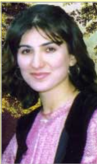
دلخۆش به‌کر ته‌یفور

له‌چی نه‌گه‌ی؟ چاویک که فرمیستکی بی رینگه و شوین تییدا قه‌تیسماوه؟! یا هه‌ناسه‌ی ساردی بی هه‌یابه‌ک له‌ قولایی ناخیه‌وه هه‌ل نه‌قولیت؟! یا له‌نیوچه‌وانیکی گرژی پر له‌ حسه‌رت و نه‌ینی ترسناک؟ یا له‌ رووخساری دایکی شه‌هیدیکی له‌یادکراو؟