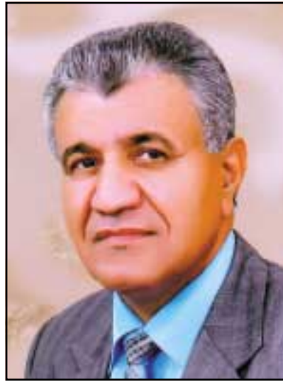
وریا جاف / کهرکووک

ئه مریۆ کهرکووک گرنگییهکی تهواوی خوئی وهرگرتوو، له هه موو میدیاکاندا باس دهکری و بهرگری له کوردستانیهتی نهکری و دژی رهفتارهکانی بهغدا بابهت بلاودهکرتتهوه کپشهیی سهرهکیشکمان مهسهلهی کهرکووک. نووسهران بهگشتی خامی پینووسهکانیان خستۆته کار بۆ مهسهلهی کهرکووک له هه موو بواریکدا. مساویهکه بهریتز تاریق کاریتی لهگۆقاری ههریمی کوردستان بابهتیک بهناوی ئه مریۆی کهرکووک بلاودهکاتهوه و تیایدا باسی له هه موو لایهنیکی کهرکووک دهکات ئه گهر که موکورتیش له باسهکانیا ههیه ئه وهی سهرنجی راکیشام و بووه هاندهرم وهلامی تاریق کاریتی بدهمهوه وتارهکهیهتی له ژماره ۵۳۹ گۆقاری ههریمی کوردستان بهناونیشانی (نووسه رانی دهقه ره که) بلاوکردۆتهوه، ئه وهی جیتی تیبینییه وتاره کهی لاپه رهیهکی تهواوی گرتۆتهوه تیایدا ناوی زۆریه ی ئه و نووسه رو رۆژنامه نووسه کهرکووکبانه ی نووسیه له بهر ههر هۆیهک بئ ئه مریۆ له کهرکووک نین و به پینچه وانه وه زۆریه ی هه ره زۆری ئه و نووسه رو رۆژنامه نووسانه ی له ناوجهرگه ی کهرکووک له به رهه می هۆیهک بئ ئامازه ی پینان نه کردوه وهک بلتی له کهرکووک نووسه رو