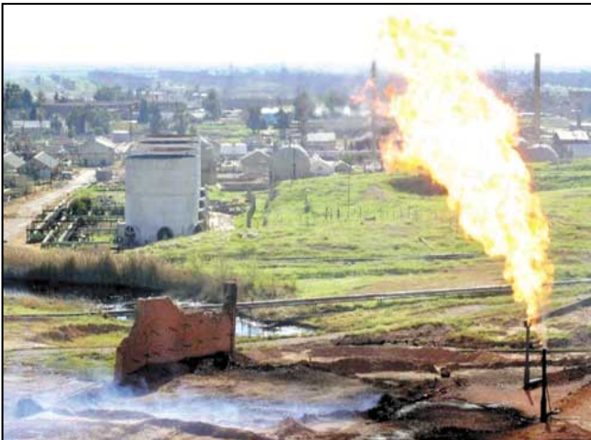
دیه نیک له شاری کهرکووک