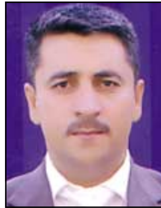
سه فەر كه ريم هوارى