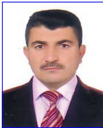
هه لوى ست رۆژه يانى

هينده ي پى ده كرى خۆى له ژى ر ده ستى سواره كه رزگار ده كات، ئىنجا سواره كه له سه ر ئه سپه كه ي دى ته خواره وه چى سه كه كه ده گرى و سوارى ئه سپه كه ي ده بيتته وه شوانه كه ش به غاره غار دى ته لاي و ده لى: جى سه كه كه م به ده وه سواره كه ش ده لى: من ئه م جى سه كه م بۆ خۆم له م گورگه ساندۆتوه تازه بۆته هى من نايدمه وه به تۆ، هه ر چهنده ي شوانه كه تكا ي لى ده كا و ده لى: من خا وه نى سه و بمده وه، به لام سواره كه هه ر ده لى: من بۆ خۆم له م گورگه م ساندۆتوه، هه ر چهنده ي شوانه كه تكا ي لى ده كا سواره كه نايداته وه بۆ خۆى ده بىا شوانه كه ش ده لى: تازه له قى س من هه ر رۆيش ت فه رقى چ بوو؟ چ گورگ بىخوا ردا به چ سوار بر دبا به.